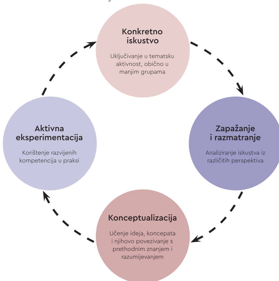
MODEL 2. Prilagođena verzija Kolbova modela iskustvenog učenja.

David Kolb je, temeljem prijašnjeg rada Deweyja, Levina i Piageta, razvio ciklus iskustvenog učenja kao procesa od četiri koraka. Taj proces započinje od odnosa učenika prema temi, iz njihova izravnog iskustva. Kroz proces promatranja i promišljanja, učenici uspostavljaju osjećaj vlasništva nad naučenim. Zaključci promišljanja su zatim povezani s apstraktnim razmišljanjem kako bi se stvorili koncepti, koji se mogu iskoristiti u novim situacijama, kako bi se naučeno koristilo u praksi. Kada se naučene kompetencije koriste u novim kontekstima, one su ojačane i čine bazu za novi ciklus učenja.